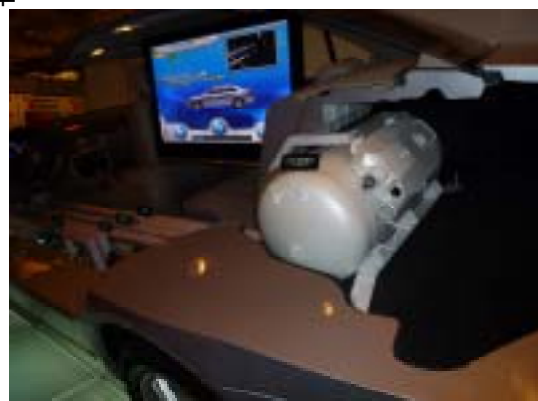
現代自動車のLPGポンペ